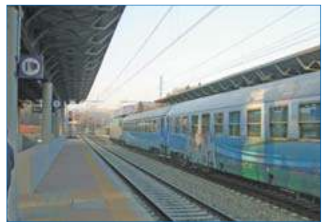
Uno dei primi treni passa dalla nuova stazione di Gozzano

Autorità e tanta gente alla nuova stazione